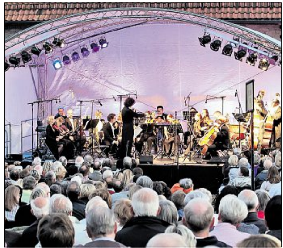
Der musikalische Abend im Klostergarten greift diesmal die britische Tradition der berühmten Sommerkonzerte auf.

frieden Kerzenständer und Engelsskulpturen. Die Idee der barocken Schönheit. Ganz locker geht es in der Pause des neunten Marienroder Klosterkonzerts zu: Erst spielen einige Gentlemen im grünen Frack auf Hörnern, dann umrunden Be-